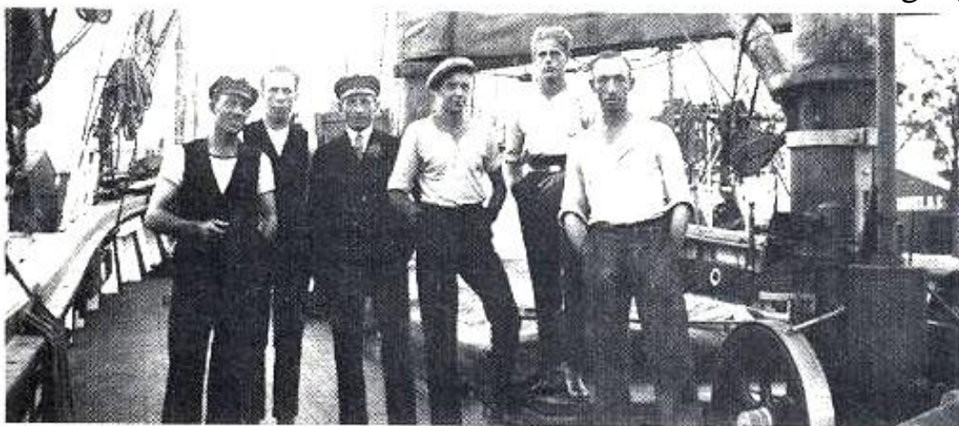
Uppställning för båtfotografen ombord på Ingo. Vem som är Sidney? Åjo, det klarar ni!

Vintern kom och Ingos och mina vägar skildes. Jag längtade till ett varmare hav än Östersjön helst så långt bort som möjligt, en önskan som i rikt mått kom att gå i uppfyllelse under åtskilliga år framöver. Ingos uppdykande i TV-rutan härom kvällen var för mej en glad överraskning. Det kom mej att i ett gammalt album leta rätt på några foton från den tid då vi båda var unga och hon var en prydnad för den svenska handelsflottan, vilket hon säkert kan bli en gång.