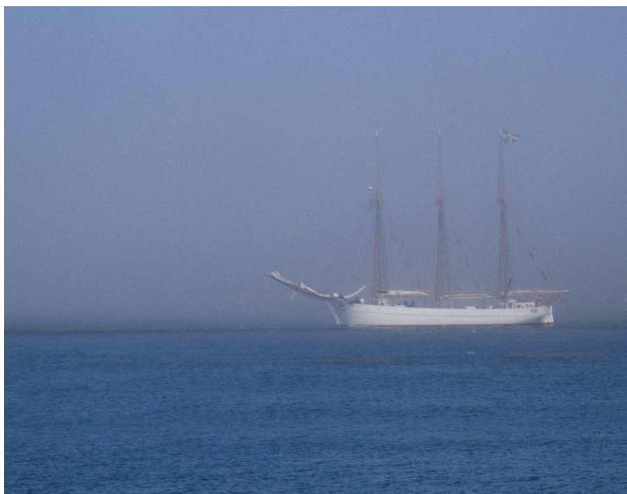
Ingo i dimma. Bilden tagen vid Nya varvet den 7 maj 2008. Dimman maskerade raffen och Renova.