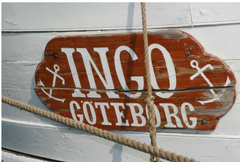
Patina är fint!