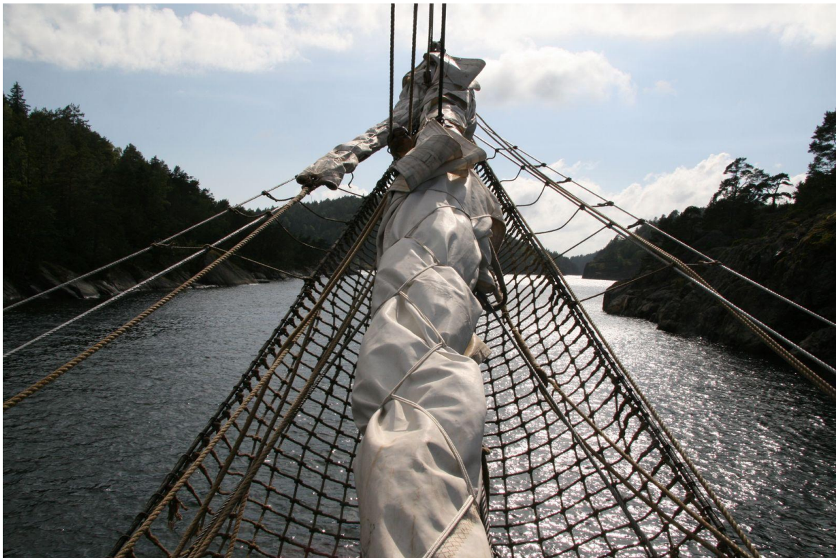
Mot nya mål.

Till detta kommer som vanligt att vi kör charter bl a Kiel, Halmstad och Rostock.